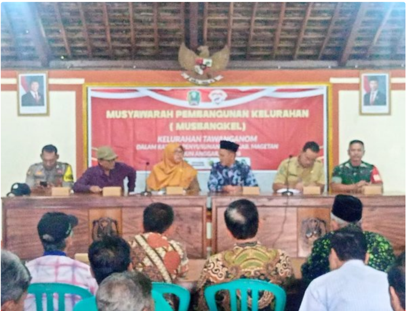
Babinsa Koramil 0804/01 Magetan Hadiri Musrenbang di Kelurahan Tawanganom

Magetan. - Babinsa kelurahan Tawanganom Koramil Tipe B 0804/01 Magetan